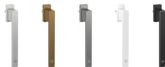
Klamki VETREX SLIDE'UP